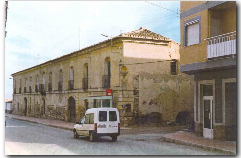
Incoado B.I.C. por resolución de la Dirección Regional de Cultura de 28 de mayo de 1.995 - B.O.R.M. nº 134 de 14 de junio de 1.985