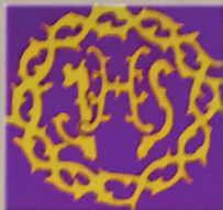
Hermandad de N° Padre Jesús Nazareno y Santísimo Cristo de la Columna