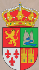
Ayuntamiento de Librilla