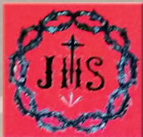
Cofradía del Santísimo Cristo del Perdón