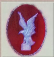
Hermandad de San Juan Evangelista