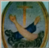
Hermandad del Santísimo Cristo de la Consolación y de María Santísima de las Penas