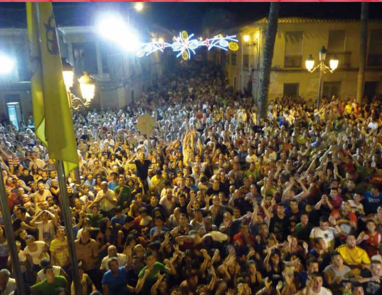
Recogiendo Pitanzas en la Plaza del Ayuntamiento.