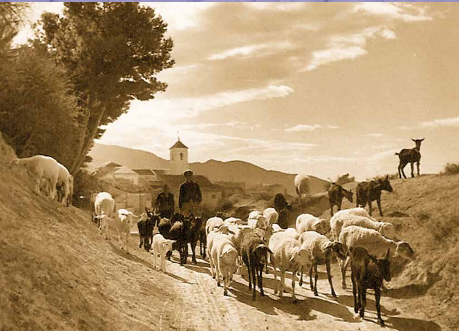
Pastores con su rebaño en "La Cañada".