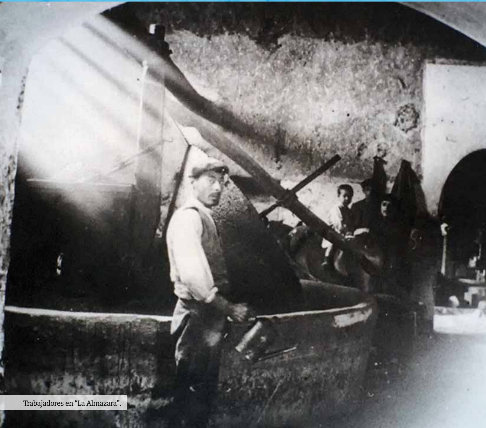
Trabajadores en "La Almazara".