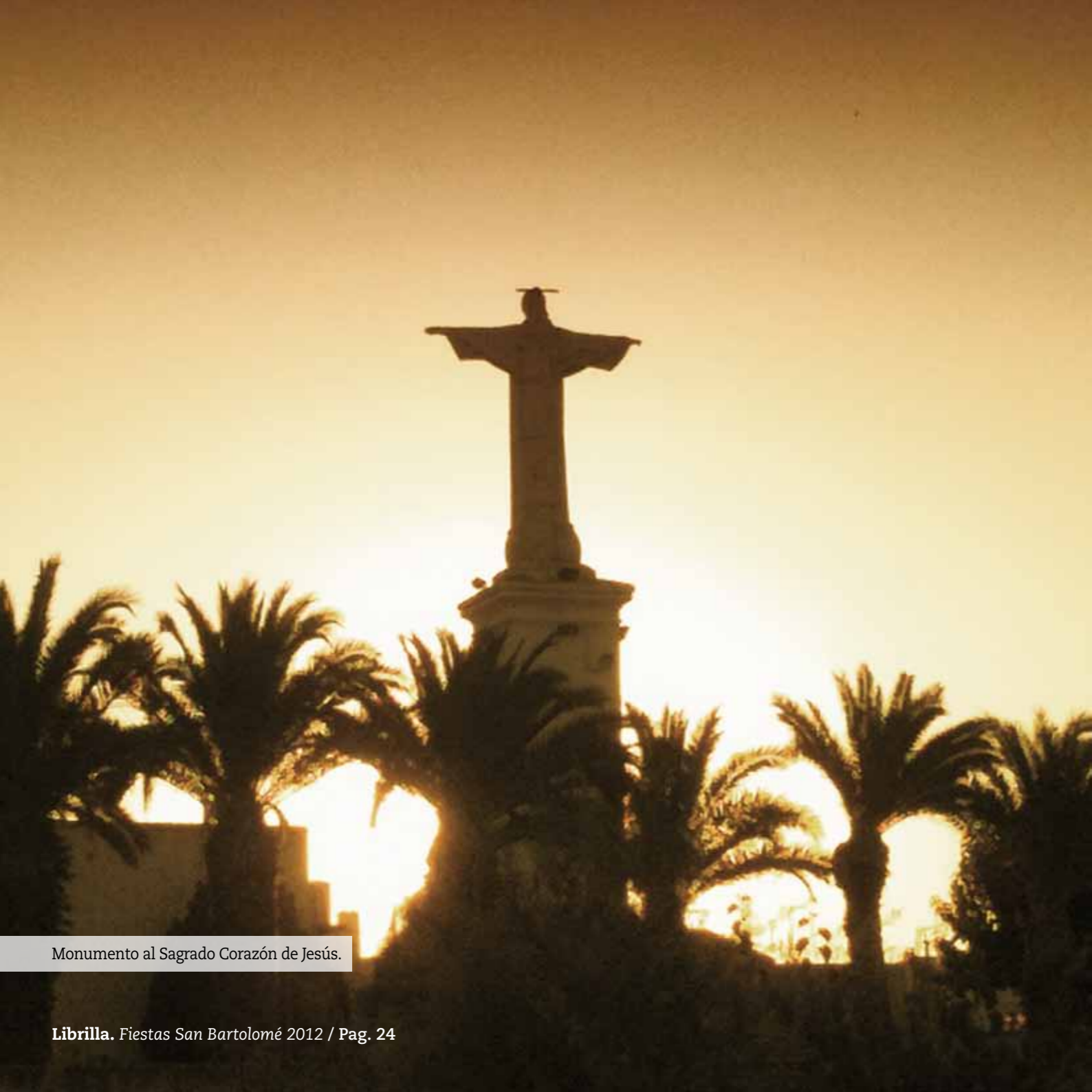
Monumento al Sagrado Corazón de Jesús.