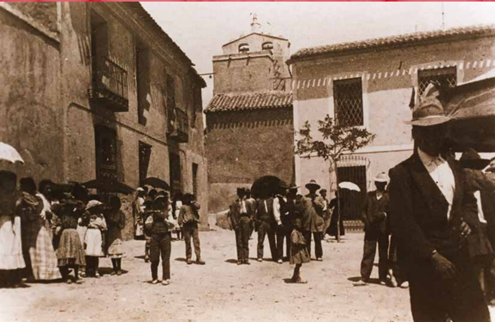
Gente en la Plaza de la Iglesia durante las Fiestas de San Bartolomé