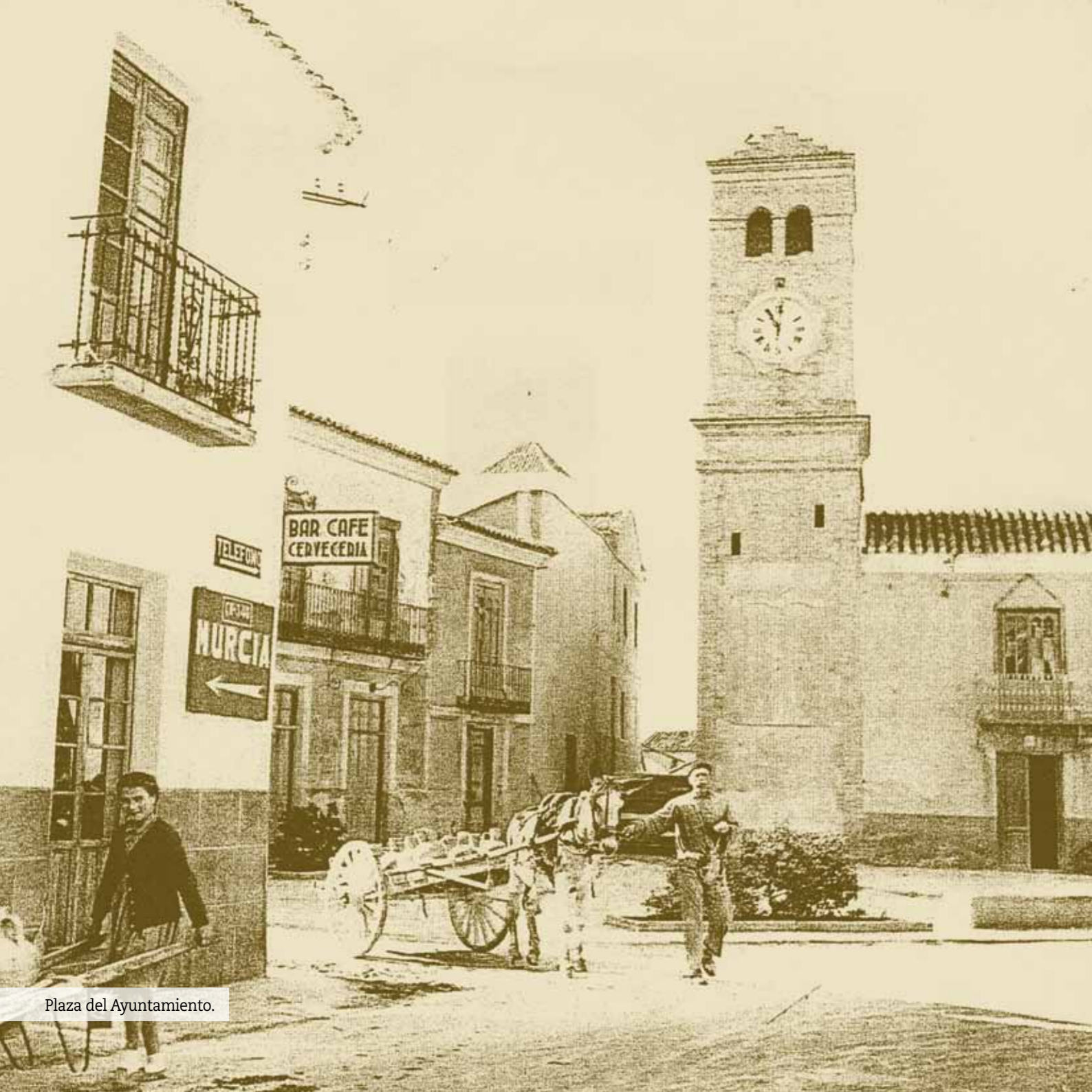
Plaza del Ayuntamiento.