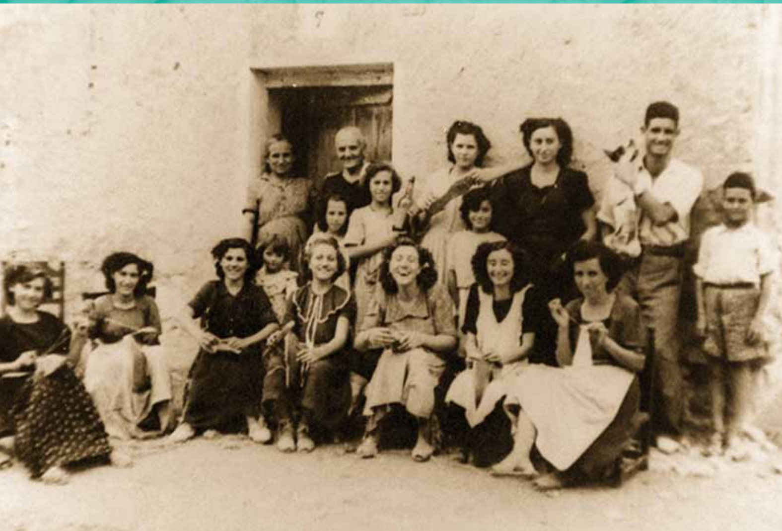
Fabrica de Alpargatas