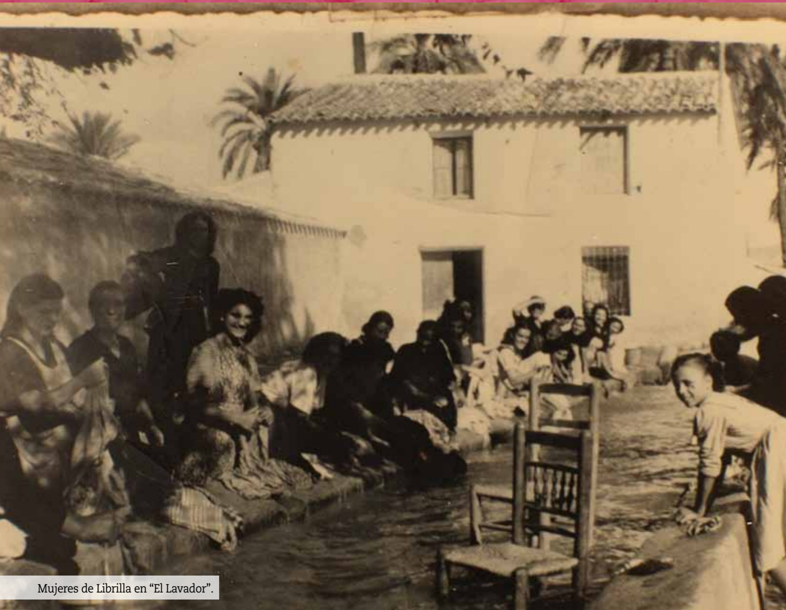
Mujeres de Librilla en "El Lavador".