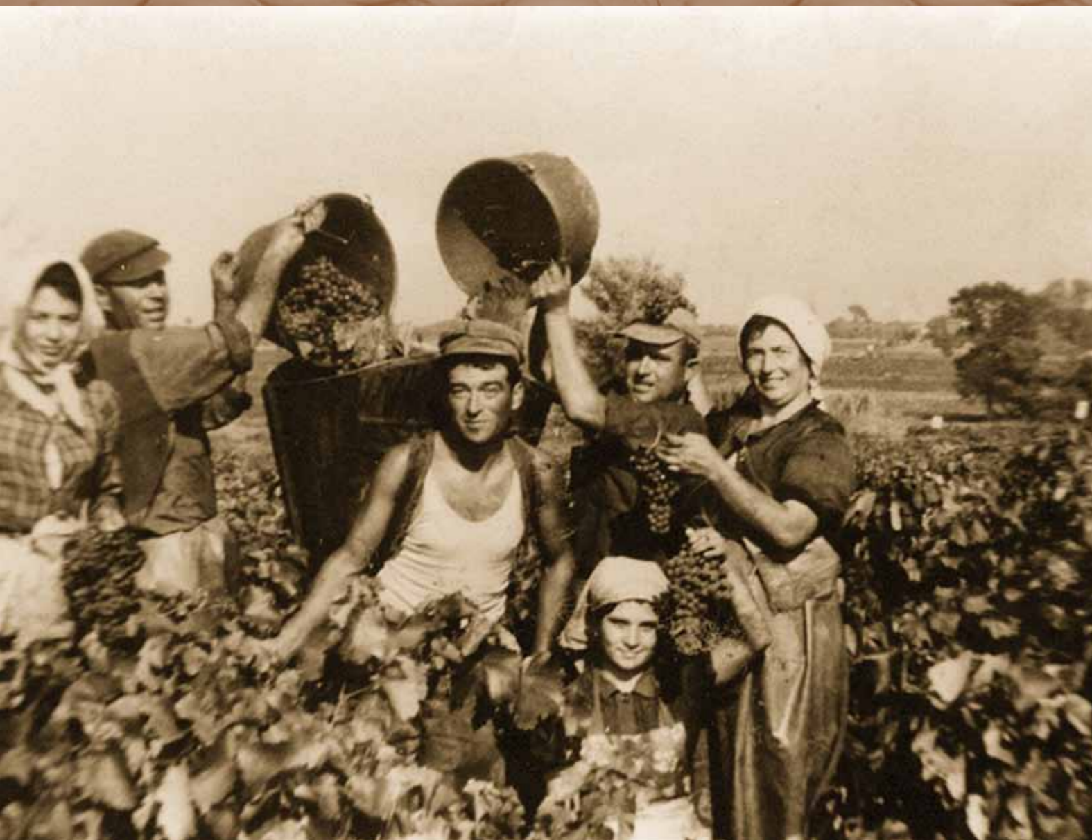
Librillanos y librillanas en la vendimia.