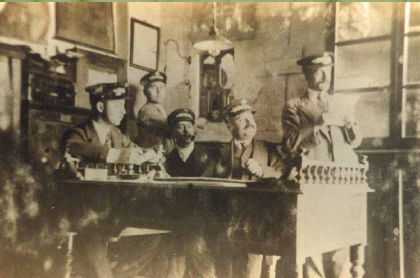
Jefe de estación, factores y mozos de carga y descarga, en la Estación de Ferrocarril de Librilla